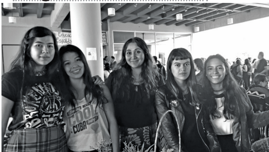
Integrantes del Colectivo Maleza

hizo realidad con el primer evento, desde ahí se realizaron varias versiones y hasta el día de hoy recibió el nombre como tal de Feria, a tal punto de que se está institucionalizando como proyecto”.