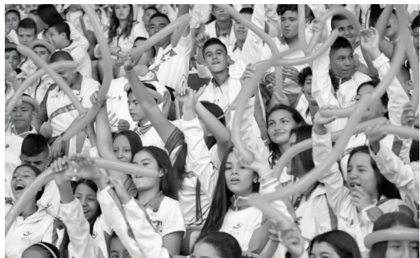
Coldeportes hizo parte con su 'Juego de Naranja' y Manual de infraestructura deportiva.

ciendo eventos de talla nacional e internacional constantemente como el Nacional de Porrismo, el Enduro World Series, la Leyenda del Dorado o el Zonal Supérate Intercolegiados. Cada uno genera en promedio 1.000 millones de pesos, entre hotelería y demás sectores de la ciudad. Además están previstos el Panamericano de Downhill y el Panamericano Nacional de Levantamiento de Pesas, informó Martín Ramírez.